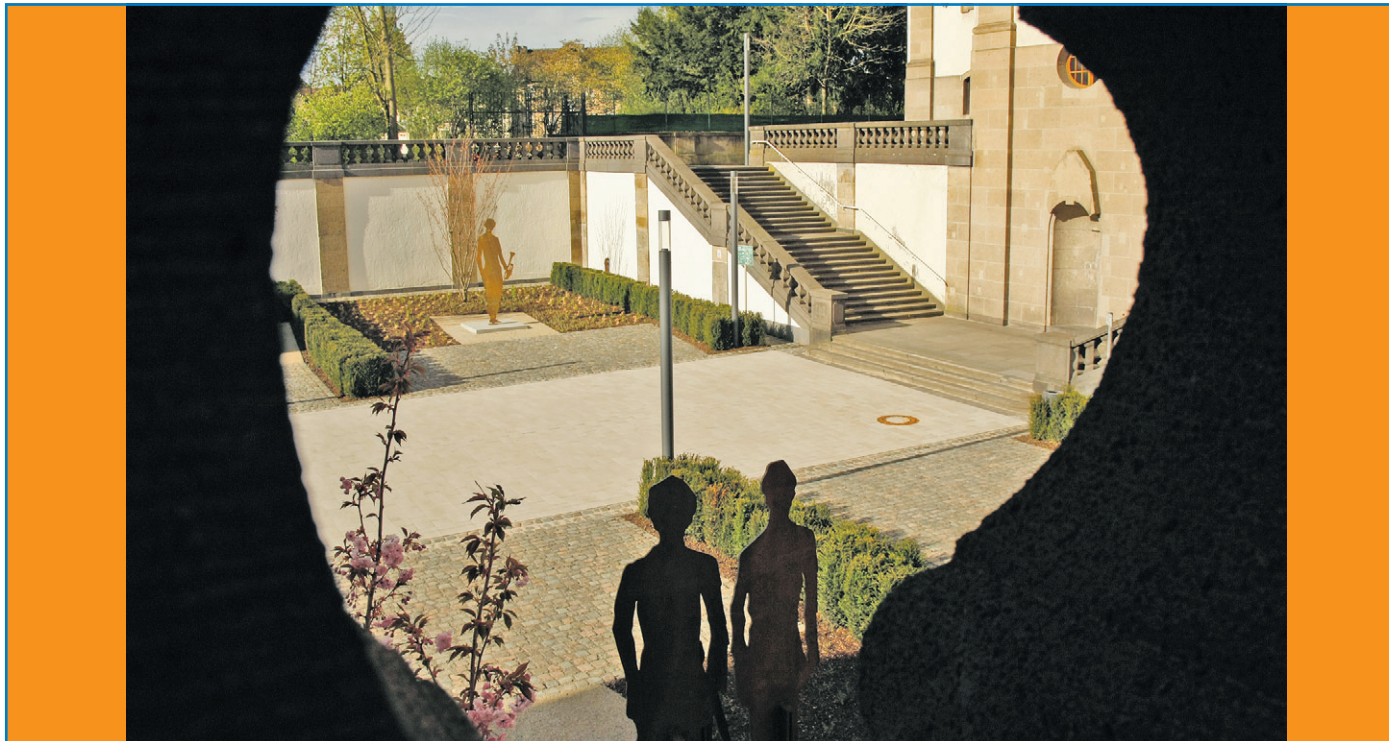
Blick auf den neugestalteten "Platz der Versöhnung" und auf Stahlskulpturen zum Thema "Begegnung."

Für unverlangt eingesandte Artikel übernimmt die Redaktion keine Haftung.